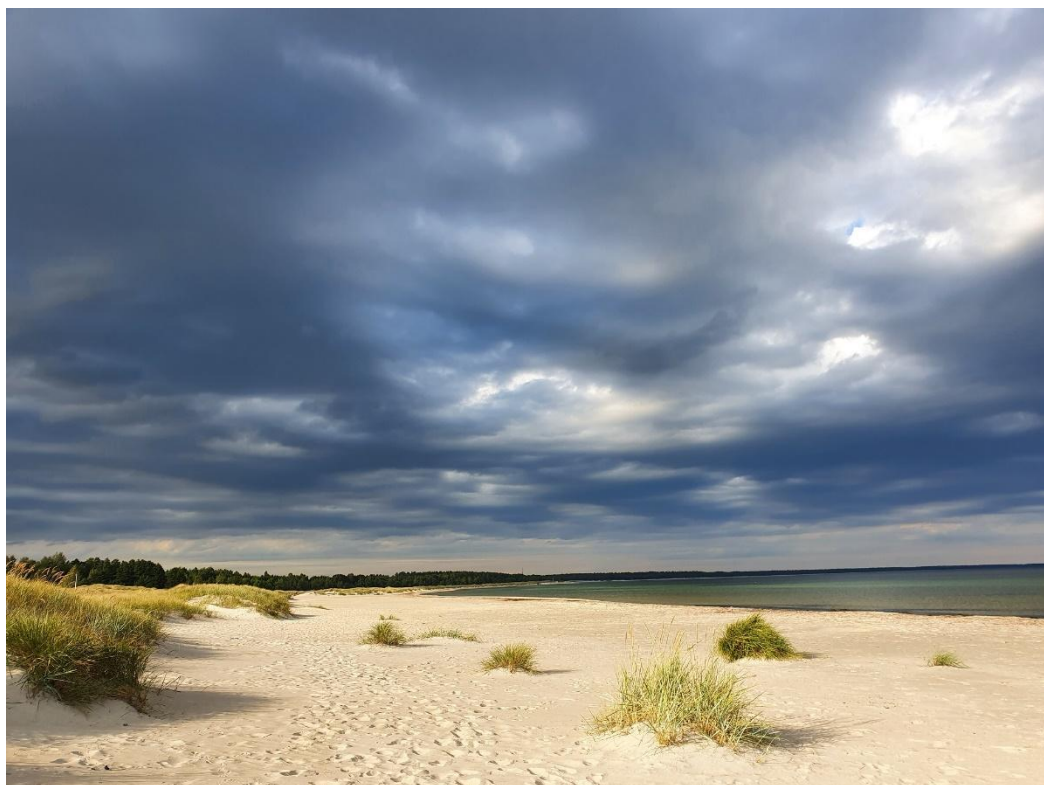
"Vår" strand på östra sidan. Bilden tagen i början av september 2020