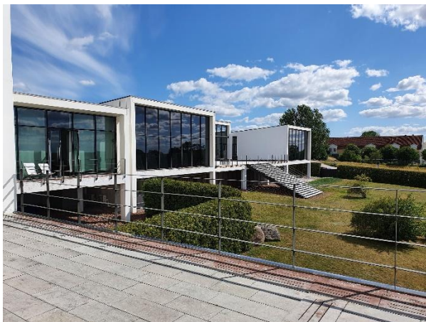
VIDA Museum & Konsthall 9 km söder om Borgholm