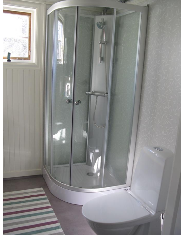
Duschrum med tvättmaskin, stort handfåt, toalett och duschkabin