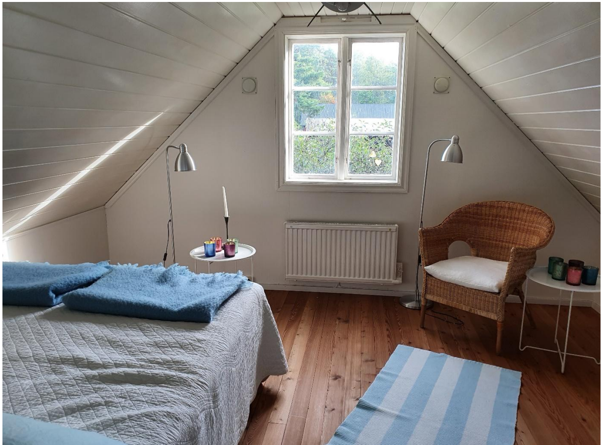
Sovrum 2 mot östsidan på övervåningen med en 160 bred dubbelsäng