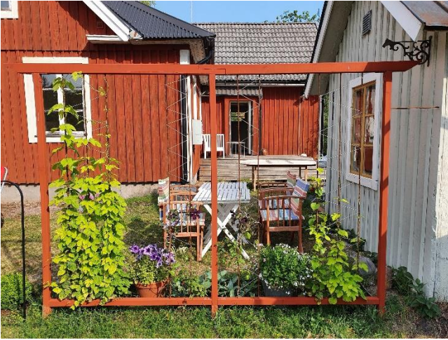
Vy av huset från sydsidan med matrum, kök och entré.

www.ateljemasoderholm.se/Oland_Pepparhagen.pdf