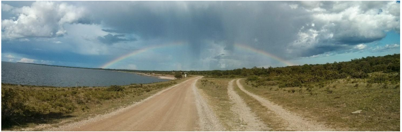
Panoramabild från västra sidan söder om Byrum