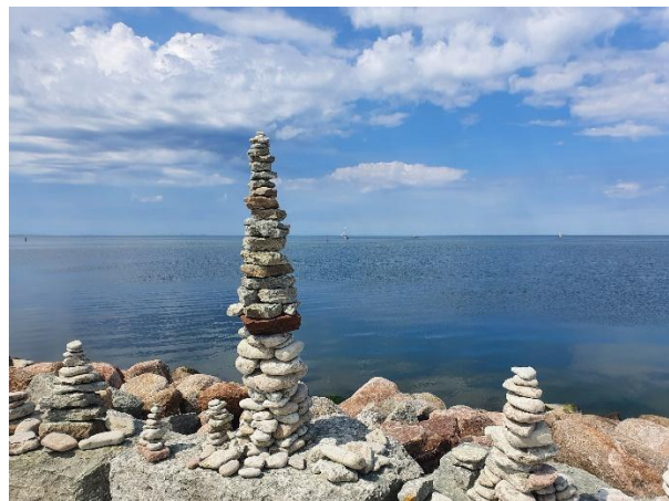
Spontana konstverk på västra sidan