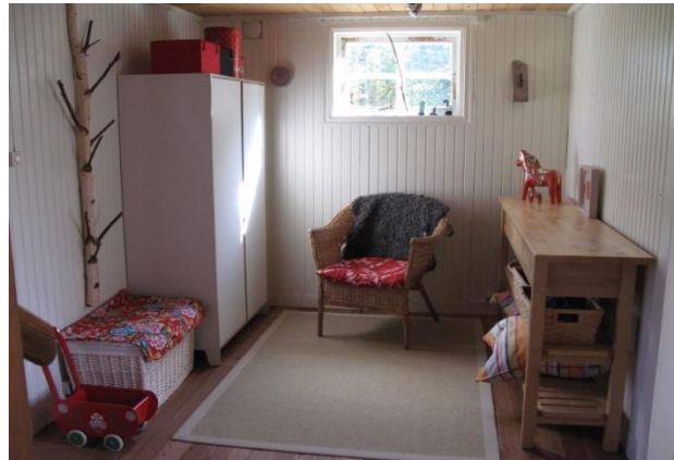
Stora hallen innanför entrén