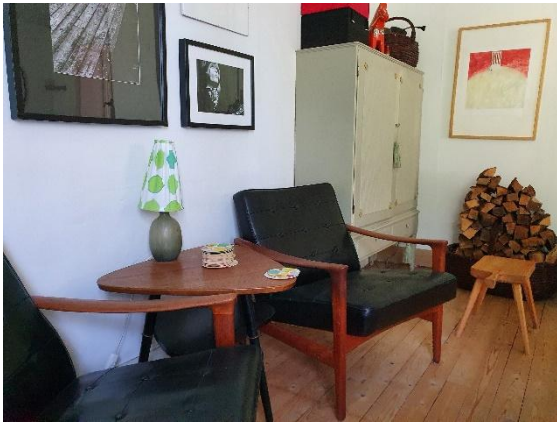
Vardagsrum med braskamin, TV och DVD