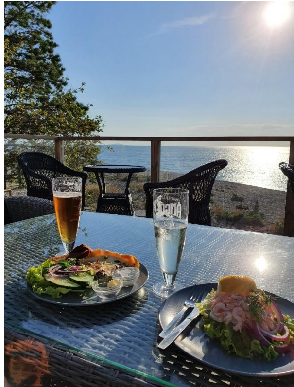
Utsikt från Cafe Stenflisan i Byxelkrok