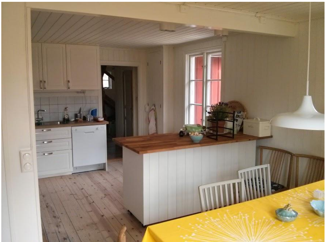
Kök och matrum. Det finns en induktionsspis med fläkt, en diskmaskin, bra med köksskåp, en köksö med mycket arbetsyta samt vit träpanel på samtliga väggar.