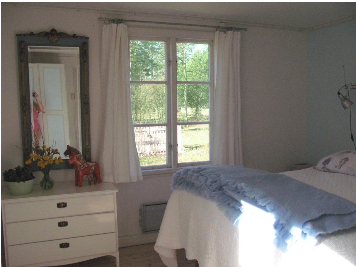
Stort sovrums på nedervåningen med 160 cm bred resäsäng. Sovrummet har två fönster i söder- och västerläge.