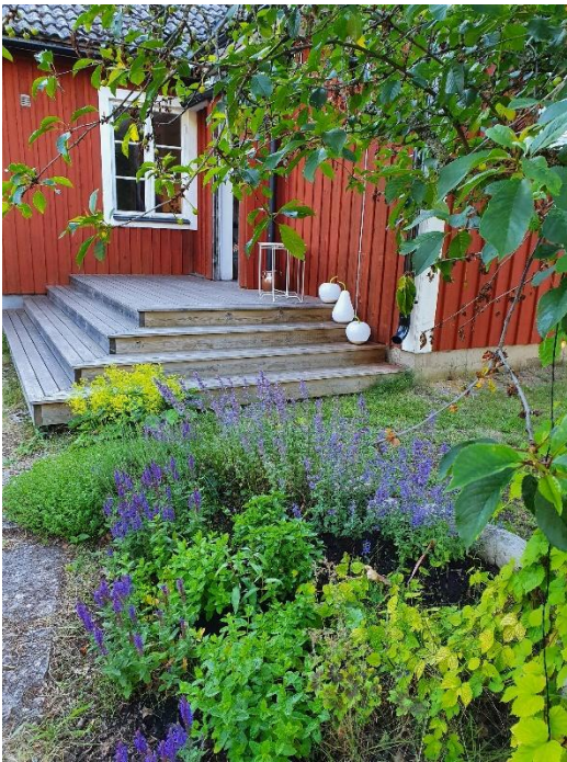
Kryddrabatt vid entréverandan.