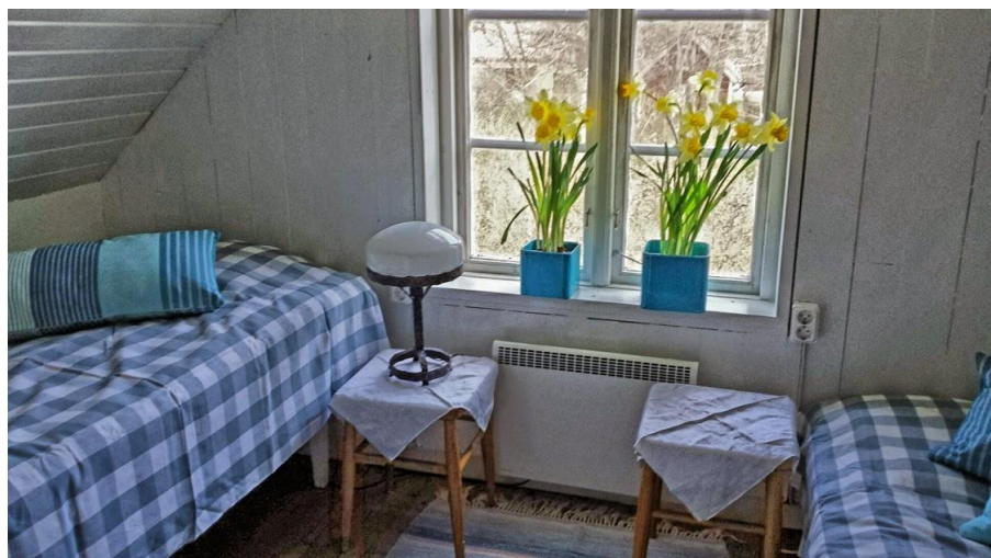
Sovrum 1 mot norrsidan på övervåning med två bäddar, en enkelsäng och en 120 cm bred säng.