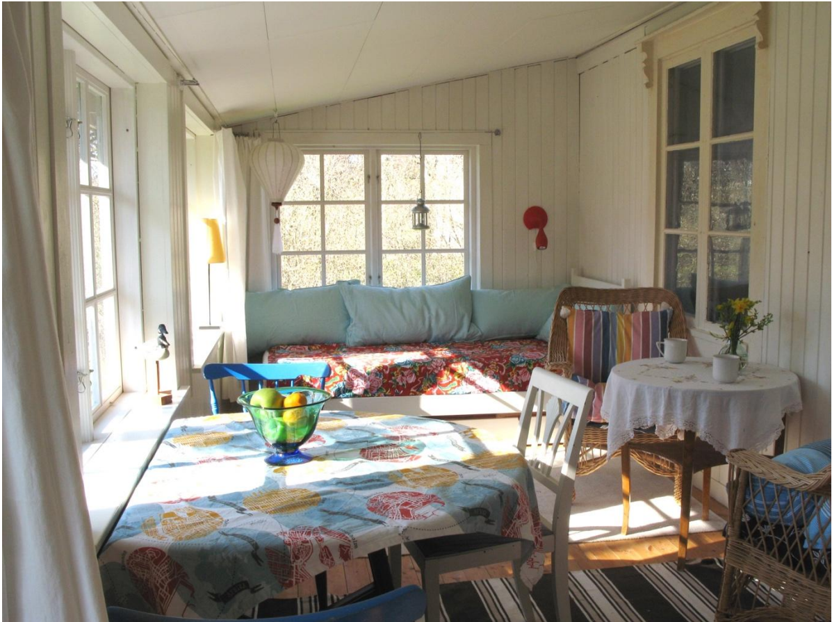
Stor glasveranda med två bäddar