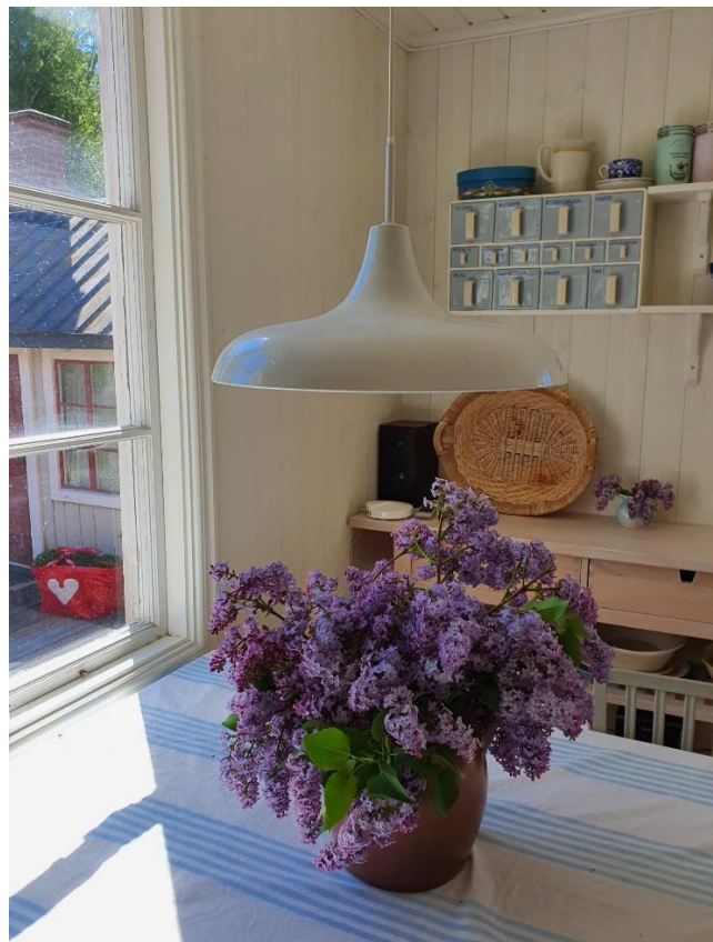
Detalj från kök och matrum, med matbord och utsikt mot ateljén