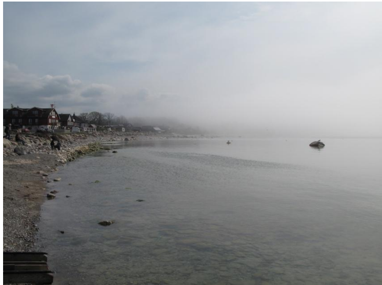
Byxelkrok i dimma