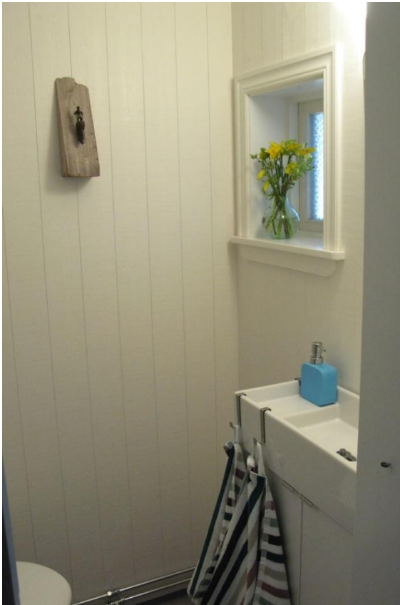
Separat toalett med handfat