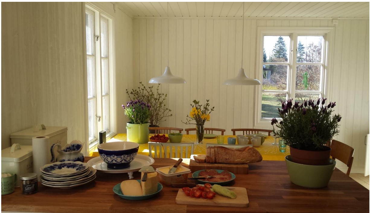
Köksö och matplats med 10 sittplatser