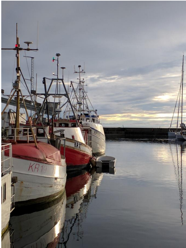
Hamnen i Byxelkrok i kvällsljus