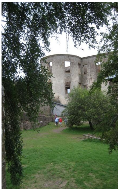
Borgholms slottsruin, en fantastisk miljö