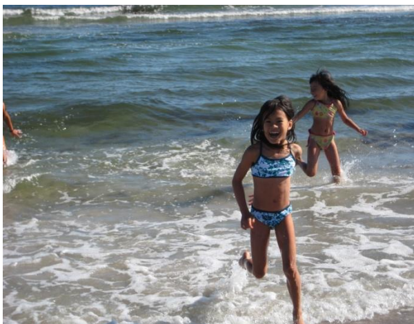
Böda vid "Kuggis"