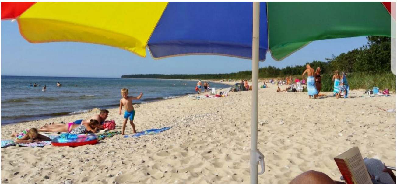
Den milslånga sandstranden på östsidan, det är långgrundt och barnvänligt.

eller kvällstur och se solen sjunka ner i havet. På vägen hem kan ni plocka blåbär om det är bärtid. Ramsnäs är ett stort naturreservat med vindpinade tallar varav en del ligger ner och är perfekta att klättra i. Det är även ett bra ställe för en löprunda. På vägen hem från Ramsnäs kan ni stanna vid järnåldersbyn i Skäftekärr.