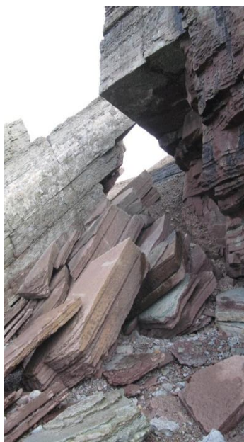
Raukar vid Byrum på västsidan