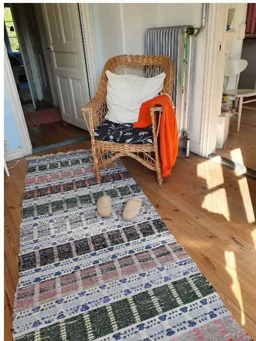
Detalj från sovrum på bottenvåningen. Kök och matrum till höger