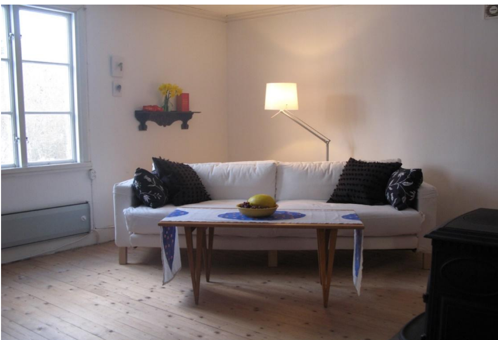
Vardagsrummet med braskamin, TV och DVD