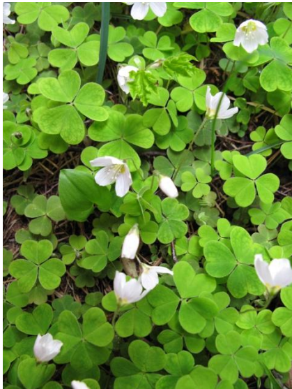
Vitsippor och klöver på tomten