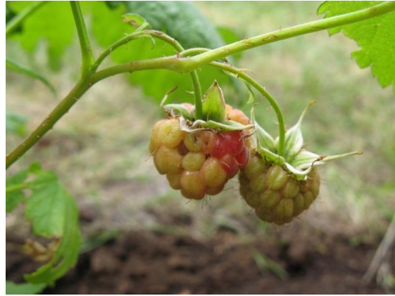
Hallon på tomten