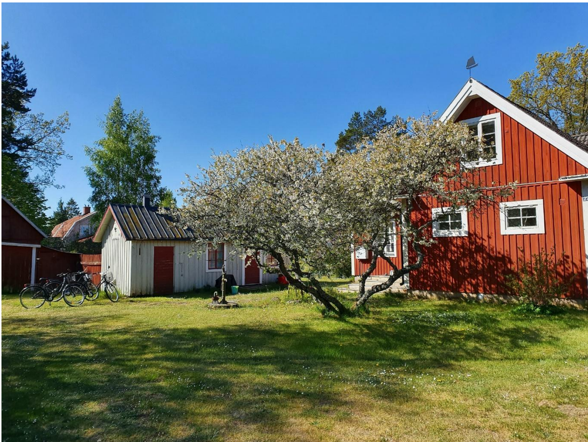
Ateljé och verkstad till vänster och boningshuset till höger, tomten är omgärdad av syrenhäckar.

diskmaskin, induktionsspis med fläkt, köksö med stor arbetsyta, frys, mikro, kaffebryggare samt gott om husgeråd. Huset har ett badrum med dusch, toalett och tvättmaskin samt ytterligare en separat toalett. Det är sol vid huset hela dagen. Tomten på drygt 1000 kvm är omgiven av en syrenhäck. Utemöbler med 10 sittplatser, tre bord samt två grillar. I ett av uthusen finns det boccia och kubbspel. Det finns även en torkvinda på tomten för blöta badkläder och tvätt.