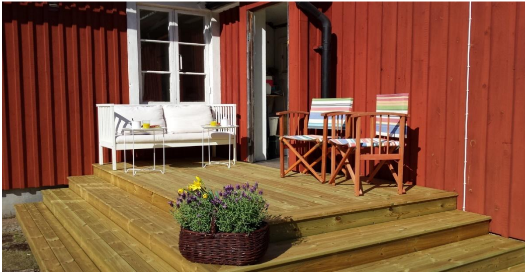
Frukostveranda och entré