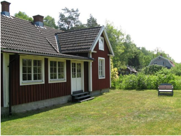
Inbyggd veranda, med två sängplatser & trädgård på västsidan.