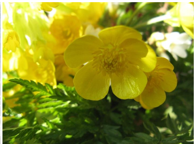
Blombild från tomten