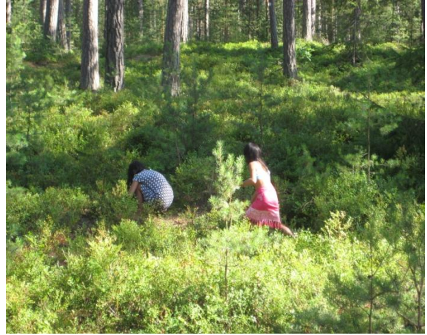
Blåbärsris på väg från stranden i Ramsnäs

Hyr vårt hus på Öland, 1 km från Ölands bästa sandstrand. Du kan gå längs hela den milslånga vita sandstranden. Bödabukten ligger på östsidan och ligger ofta i skydd av vindarna. Vill du ha lite mer dramatik kan du åka till Ramsnäs som ligger en halvmil bort på västsidan, även den väldigt lång med blandad sand och stenstrand. Ta en eftermiddags-